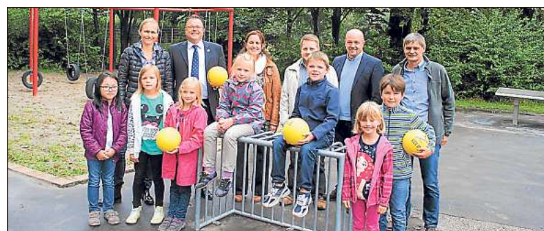
Über die neuen Fußballtore freuen sich Schüler und Lehrer der Liesborner Grundschule.

Der Förderverein bedankte sich bei der Verwaltung und spendete Fußballtore, die die Kinder sogleich nutzen, um die Fußballtore auf Herz und Nieren zu testen.