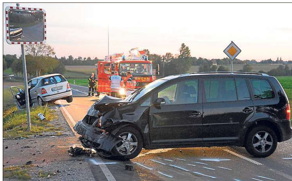
Eine 43-Jährige aus Wadersloh und vier Kinder saßen in dem VW Touran, der mit dem Mercedes einer 79-Jährigen zusammengestoßen war.