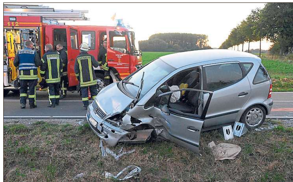
Schwere Verletzungen trug die Wadersloherin davon, die mit ihrem Auto vom Norenkamp auf die Langenberger Straße einbiegen wollte und den schwarzen Van übersah.