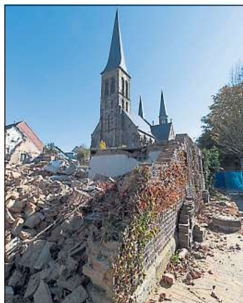
Der Abriss im Ortskern hat begonnen.