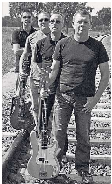
„Sonic Turf“ heizen als Vorgruppe ein.