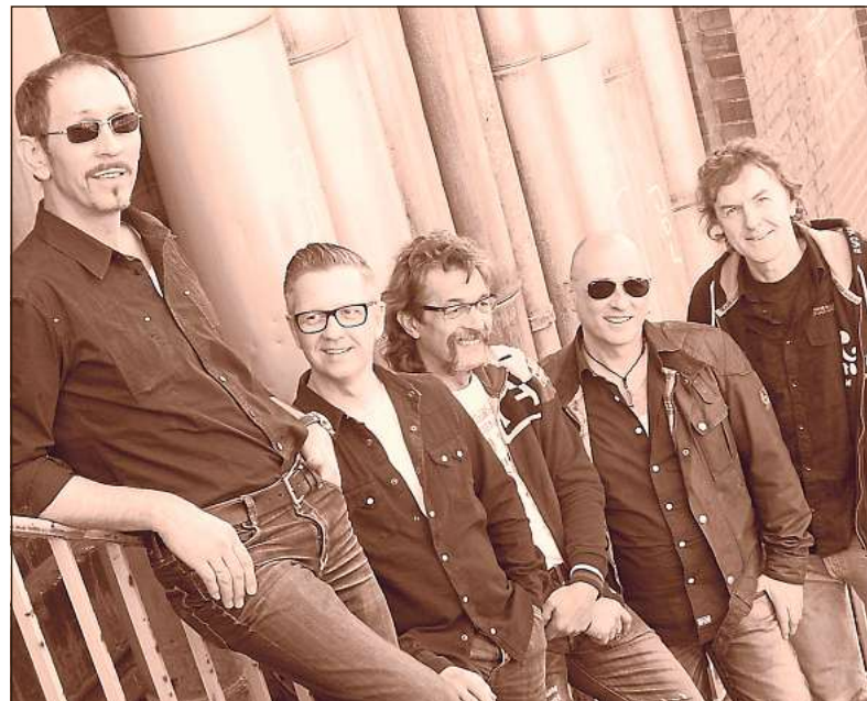
„Tubeway For“ spielen am Samstag, 4. Juni, beim „Rollin'Rock im Park“-Festival im Kurpark von Bad Waldliesborn. Der Eintritt ist frei.