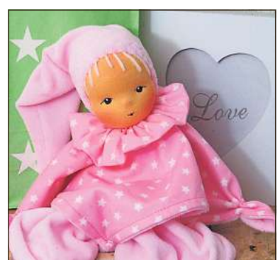
Puppen können Wadersloher bei einem VHS-Kursus gestalten.