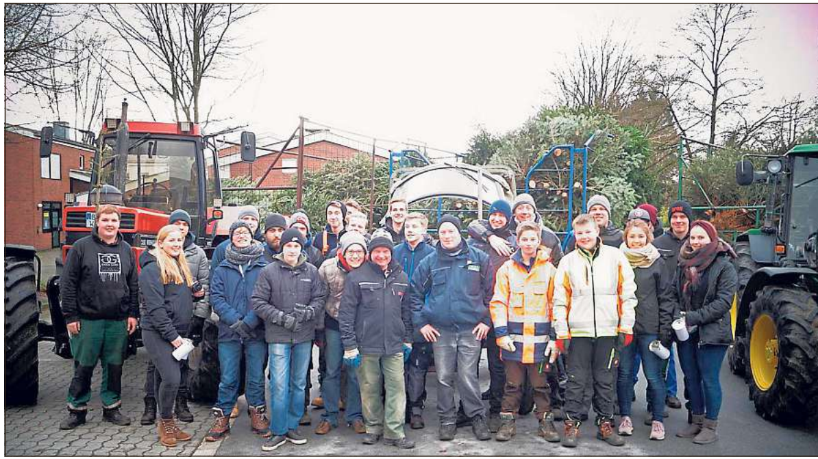
40 Helfer der Kolpingjugend rückten am vergangenen Samstag in Wadersloh aus, um die aus dem Haus geschaffenen Weihnachtsbäume einzusammeln.