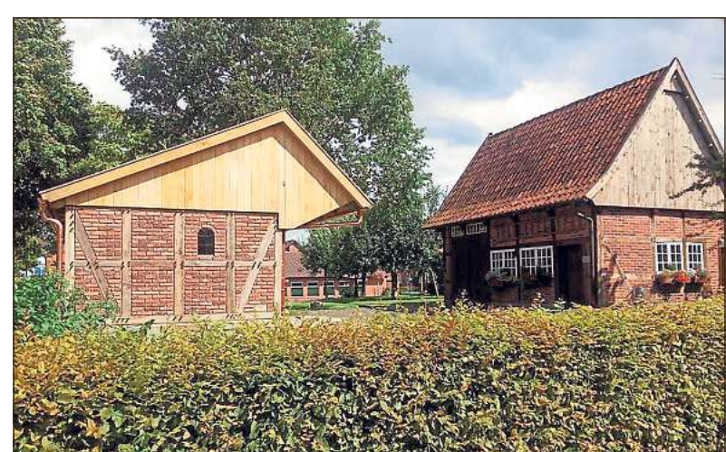
Eine Einheit: Zusammen mit dem Backhaus (rechts) ergibt die Remise den Charakter einer kleinen Hofstelle, wie sie in früherer Zeit vielfach in den westfälischen Dörfern zu finden war.