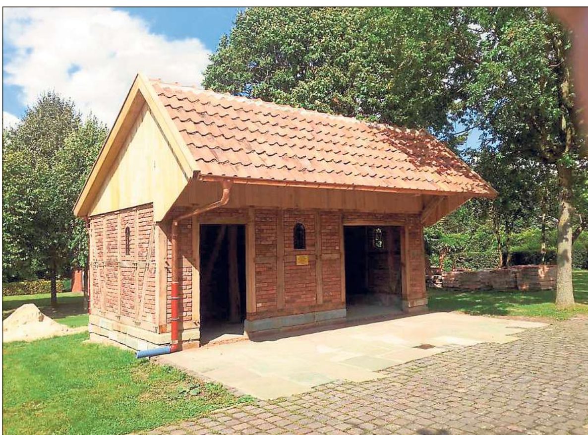
Ein Schmuckstück: Die Remise in Diestedde wurde von vielen fleißigen Helfern aus historischem Baumaterial errichtet.

Um ein authentisches Bauwerk zu erhalten, sollten dabei möglichst Materialien aus anderen alten Gebäuden wiederverwendet werden. So machten sich eifrige Helfer zunächst ans Werk, um historisches Baumaterial zu sammeln: Bossen für die Grundmauern, alte Holzbalken für das Fachwerk, Backsteine für die Wände, Hohlpannen für das Dach und Deelensteine für den Fußboden wurden von abgebrochenen Häusern und Scheunen aus der Umgebung zusammengetragen und in mühevoller Kleinarbeit gereinigt und aufgearbeitet.