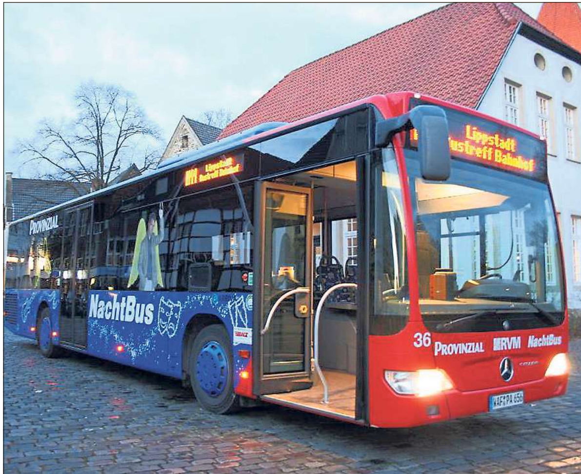
Das Angebot dient der Teilhabe an einem Nachtleben, das Wadersloh und seine Ortsteile nicht zu bieten haben. Deshalb sind Beckum und Lippstadt Ziele des an Samstagen verkehrenden Nachtbusses.